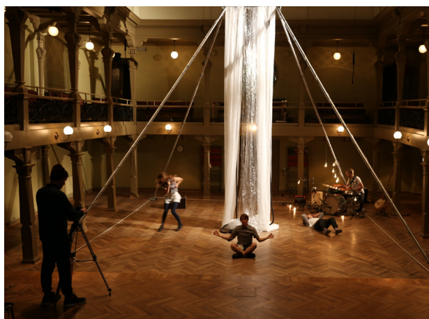
Vår fristående luftrigg.

Hör av er så försöker vi lösa det! Viss av önskad teknik kan vi tex. tillhandahålla själva om nödvändigt.